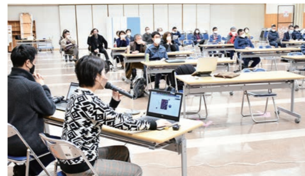
活動を報告する地域おこし協力隊

越えた隊員間の交流機会を設けることができなかったことでもあります。今後は、さまざまなメディアを通して隊員たちの活動を紹介しながら、町民と隊員間および隊員同士の交流の機会を設けて、互いを知り、地域に隊員の存在感が浸透していくよう努めてまいります。地域おこし協力隊、地域活性化起業人、地域おこし協力隊インターンとその形態や活躍の場はますます広がっています。いずれも人生のターニングポイントで自ら本町を選択してくれた貴重な人材ばかりであり、町民の中で支援の輪が広がっていくよう取り組んでまいりますので、皆さんから親しくお声がけくださることを願っています。