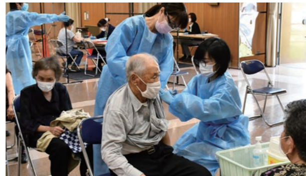
65歳以上のワクチン接種

新型コロナウイルス感染症対策については、国からの通知に基づき、町内の医療機関と連携してワクチン接種を実施していくとともに、感染状況に応じて必要な対策を講じてまいります。