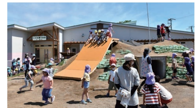
こども園つみきの園庭

また、国の保育指針改正に伴う保育環境の変化に加え、低年齢の子どもの入園希望も増えており、保育士の確保が課題となっています。保育士資格取得支援や処遇改善などにより保育体制の充実強化とともに、ホームページを通じてこども園の取組や保育の様子を発信し、保護者や保育人材から選ばれるこども園をめざしてまいります。