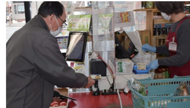
あつまるカードを利用する買い物客

また、コロナ禍により2年の長期間にわたり停滞している地域経済の元気回復のため、時期を見定めながら消費拡大策を効果的に展開してまいります。