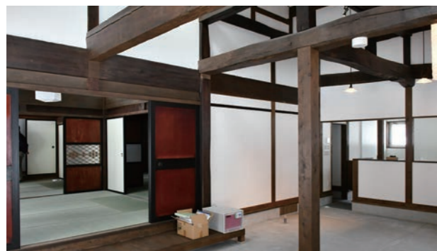
移築再生した旧山口邸

コロナ禍を契機として観光志向も変化しており、キャンプなどのアウトドア、地方へのワーケーション、近郊へのマイクロツーリズムへの関心が高まっています。新しい生活スタイルに合わせて安全・安心に配慮した施設管理やイベント運営が恒常化すると予想されます。本町の観光施設もポストコロナ社会を見据えて安全・安心に配慮した設置・改修を進めてまいります。