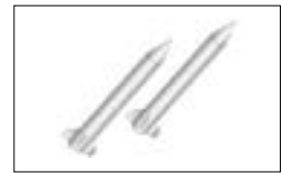
弾道ミサイル攻撃