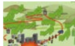
ゲリラ・特殊部隊による攻撃