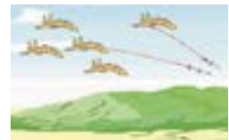
航空機による攻撃

武力攻撃やテロなどが迫る、または発生した地域には以下の方法で警報の内容が伝えられます。