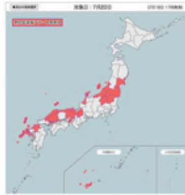
◀2021年7月19日の熱中症警戒アラート