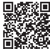
マイナポータル 年金に関する情報の確認と申請について

子申請も可能で、国民年金第1号被保険者加入の届出、国民年金保険料免除・納付猶予の申請、国民年金保険料学生納付特例の申請が可能です。スマートフォンからいつでも申請ができるので、窓口に向く必要はなく、来庁する時間がない方にもおすすめです。処理状況や審査結果も確認することができます。