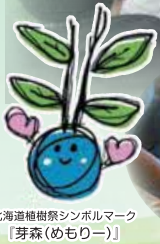
北海道植樹祭シンボルマーク 【芽森(めもりー)】