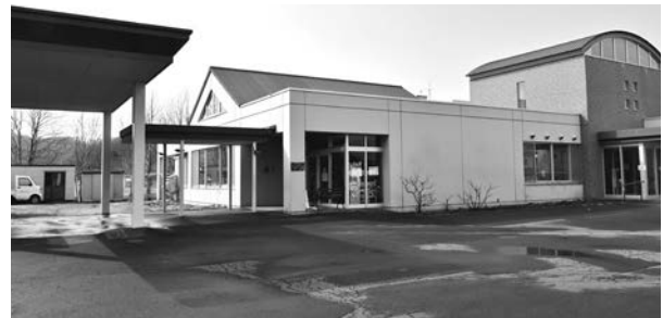
共生型放課後等デイサービスセンターを開設する小規模多機能ホームほんごう