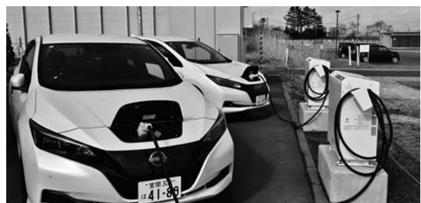
宮の森こども園に配置された電気自動車

本年度は民間企業と学術機関との協働で、北海道に適応するZEH等仕様の開発、寒冷地での使用を想定したオフグリッドハウスの研究・開発の実証事業を展開し、ゼロカーボンビレッジの早期実現に向けた取組を加速してまいります。