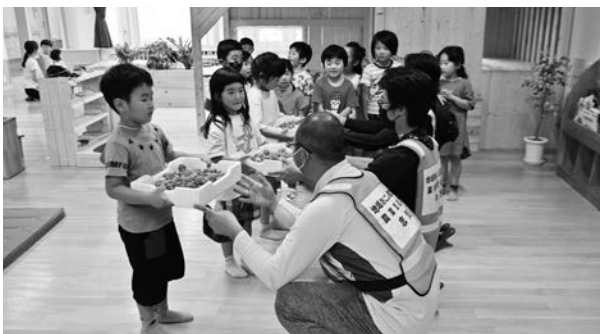
農業担い手育成センターで収穫したイチゴを寄贈

本年度は、木質バイオマス発電設備の排熱を利用してイチゴ栽培を行う最先端デジタル園芸栽培施設が、新町地区において稼働いたします。既存の農業者や新規就農者のモデルとなることをめざすとともに、雇用創出や新たな特産品となるよう、産地化形成に取り組んでまいります。