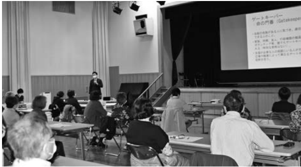
3月に開催したゲートキーパー養成講座