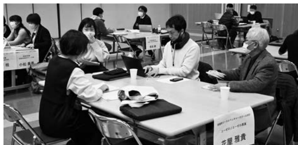
1月に一次選考を行ったローカルベンチャースクール

一方で、「地域おこし協力隊員の顔が見えない」、「どのような活動をしているかわからない」などの声も聞こえてきます。今後は、さまざまなメディアを通して隊員たちの活動を紹介しながら、町民と隊員及び隊員同士の相互交流の機会づくりに努めてまいります。