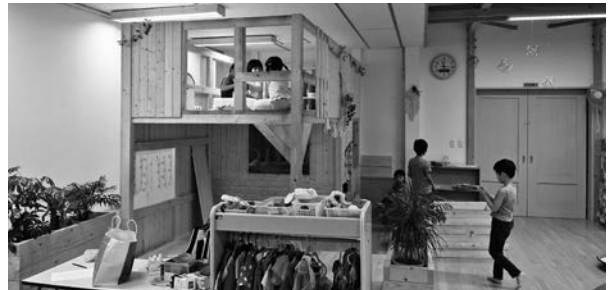
ロフトが設けられた子ども園つみきのホール

妊婦等を対象に情報提供を行いながら、ケースに応じて必要な支援につなげるとともに、児童虐待の予防や早期発見できる体制を構築してまいります。