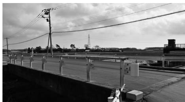
架け替え工事を行う町道軽舞豊丘線の官光橋

いずれも本町にとって重要な路線や河川でありますので、整備の促進について関係機関一丸となって取り組んでまいります。