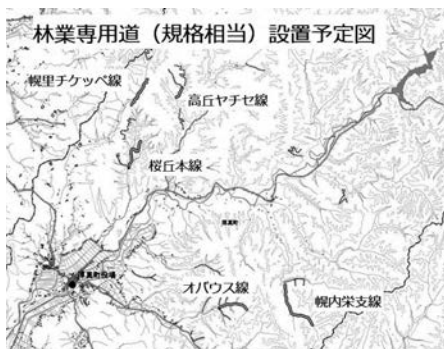
森林再生路網整備エリア

また、表町バイパス線（仮称）整備事業の着手に伴い、周辺の土地をパークゴルフ場等の憩いの場としても活用可能な災害時空地として整備するために必要な調査を実施するとともに、都市公園施設の老朽化対策として、長寿命化に必要な施設の点検と修繕計画を策定いたします。