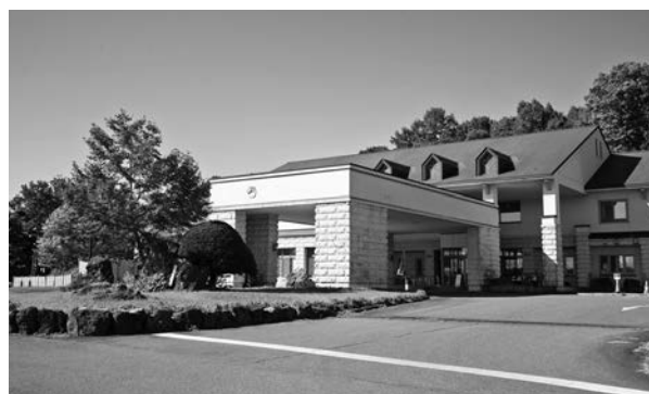
屋根や浴室天井を改修するこぶしの湯あつま

昨年度、新型コロナウイルス感染症の拡大防止に留意しながら、「あつま田舎まつり」をはじめとする各種観光イベントを開催できたことは、まちの賑わいを取り戻す契機となりました。本年度につきましても、基本的な感染予防に協力を頂きながら、主催団体の提供する楽しい場所、心安らぐ時間、心躍る時間を支援してまいります。