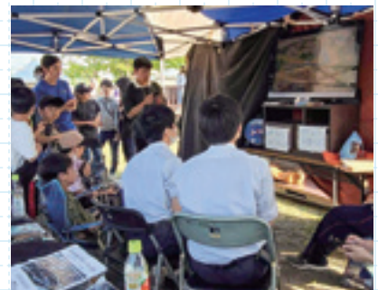
大勢の子どもたちの 歓声が響いたブース

翌月には厚真神社で行われた「鎮守の杜マルシェ」で同様のブースを出展しました。こちらは事前にチラシを作成して、町内のさまざまな場所でチラシを張ってもらうようお願いしに周りしました。厚高生があまり立ち寄りしないお店に行きたくらいのため、最初は緊張していた様子でしたが、徐々に自信を持って話ができるようになりました。ゲームがきっかけでしたが、画面の外とのつながりをもつことができたこの2カ月。経験がまた一つ増えました。