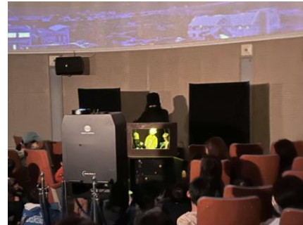
人形劇「銀河鉄道の夜」公演