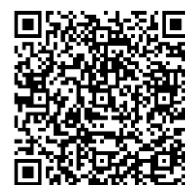
厚真町ホームページ

「令和5年度全国学力・学習状況調査」の詳細な内容については、右図のQRコードからアクセス可能な厚真町のホームページで確認できます。ぜひ、ご覧ください。