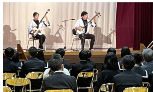
津軽三味線での曲弾き対決