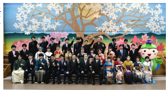
昨年度の二十歳のつどいの様子

※以前厚真町に在住していた方で、参加を希望する場合は、教育委員会までご相談ください。