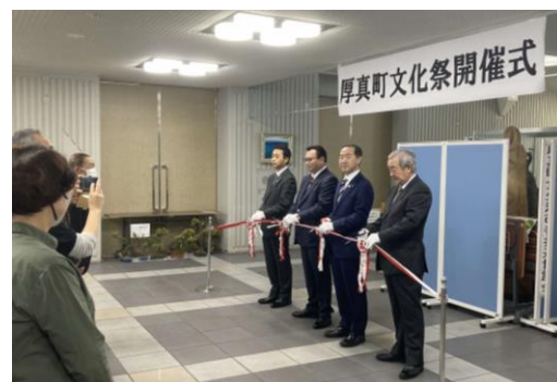
開会式でのテープカット