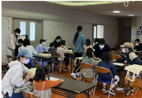
工作会場内の様子