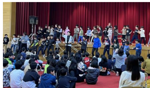
児童と一緒にソーラン節の体験

今回は、声をだして掛け声やお囃子 はやし をするなど、演奏者と一緒に参加していく体験型の内容となっていました。津軽三味線や民謡ならではの文化に触れた子どもたちから「その場でリクエストを聞いての即興弾きがすごかった」「楽しかった！」とたくさんの感想を聞くことが出来ました。