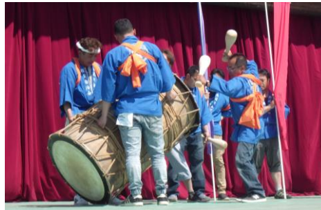
田舎まつり本祭ステージでの披露