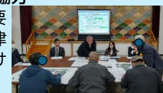
【地域の検討イメージ】

○地域の自治会・自主防災組織との協力 地域には、避難に配慮が必要な方(要配慮者)が暮らしています。地震や津波が発生した場合、地域で声を掛け合い、避難を行うことが重要です。地域の皆さんで話し合いましょう。