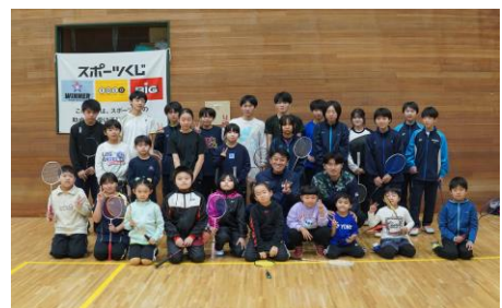
町内外から多くの方に参加いただきました