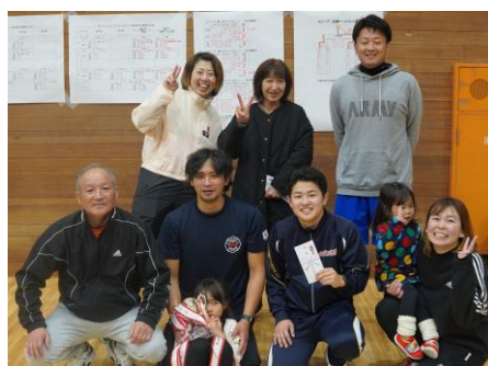
Aリーグ優勝 マーボーレッド