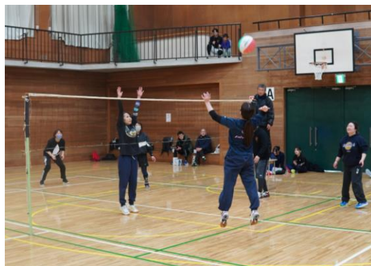
白熱した試合を繰り広げる選手たち

ミニバレーボールは、どの年代の方でも気軽に楽しむことができ、仲間との交流促進や健康増進にも適した競技です。次回もぜひ多くの皆さんにご参加いただき、一緒にいい汗をかきましょう!