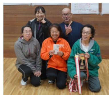
Bリーグ優勝 ざーます+