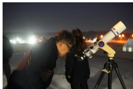
11月の星空はとてもきれい