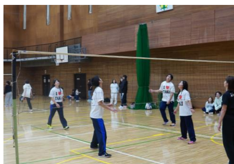
厚真高校からは2チームが参加