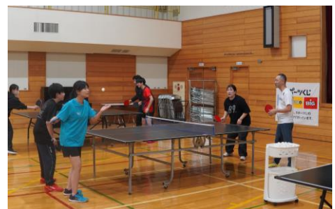
世代を問わず卓球を楽しみました