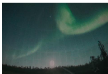
オーロラをプラネタリウムで!

後半は、天体観測を実施。数日前までの雨予報が晴れに変わり、天体観測も無事行うことができました。天文台では月や土星などをきれいにすることができ、屋上ではデジタル天体望遠鏡を使って土星や星雲などを観察。事前にプラネタリウムで解説をしていただいたこともあり、参加者も星のことについて詳しくなっており、天気も味方して、とてもきれいな星空を見ることができました。