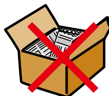
ダンボール箱に入れた例

●粘着テープでしばって出されますと、リサイクルできません。 ●ダンボール箱に入れますと、中に新聞紙以外のものが混入しているかどうか確認を要し、回収する際に余分な時間を要します。