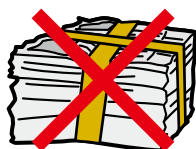
粘着テープでしばった例