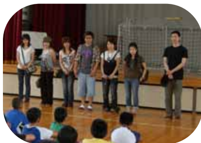
▲昨年、厚真町に訪れた留学生の皆さん(富野小学校で児童と交流)