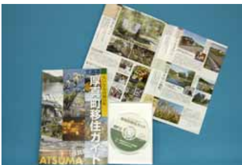
厚真の魅力を伝えるDVDとパンフレット

同ガイドは、A4判カラー刷りパンフレットと約20分間のDVDの2種類で、作製数はそれぞれ3千部と100枚。DVDとパンフの中は、四季折々の田園風景や催し、分譲住宅地、公共施設などを掲載しているほか、厚真に移住して暮らしている数家族の皆さんが、厚真の魅力を伝える内容となっています。作製したパンフとDVDは、東京や大阪などの北海道事務所や道内のアンテナショップなどに配布される予定です。