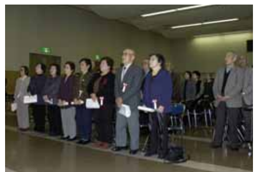
ほたる 蛍の光を歌う卒業生たち

式では、9人の卒業生に副学長の畑嶋助役から卒業証書が授与され、副学長から「地域のいろいろな行事に参加し、趣味や生きがいを持って元気に毎日を送ることが地域の力になり、その姿を拝見することは私たちの励みになります」とお祝いの言葉が贈られました。