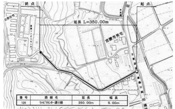
▲▼リハビリセンター通り線