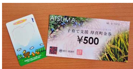
子育て支援ポイントカード（左）と 子育て支援厚真町金券（右）