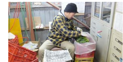
ほうれん草農家での研修

2年目は、ほうれん草とピメントの専門的な勉強をしたいです。そして3年目は自分で畑を耕したいと思っています。そのためにトラクターの運転免許を取得したいです。