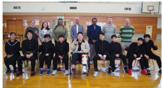
参加したALTと厚南中1年生