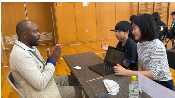
ALTと会話する厚真中央小5年生

中学生は、その成果を引き継ぎ、さらに教科としての英語を頑張ってきました。「オリジナルの厚真ツアーを紹介する」として、学習用端末を使いながら英語で伝えていました。はじめは緊張していた生徒たちも、最後には自分の思いを伝えることができた達成感でいっぱいの様子でした。