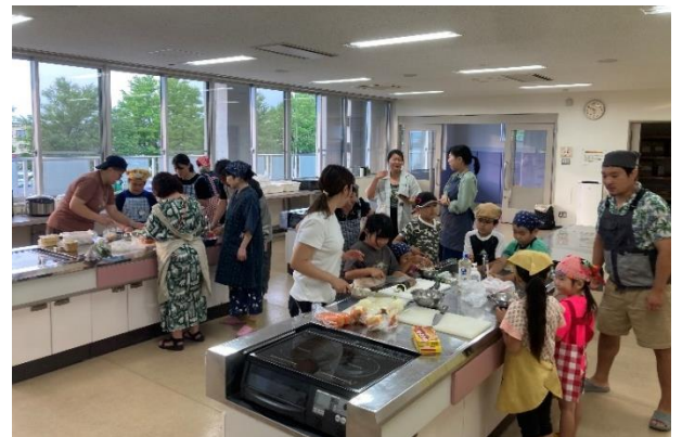
7月10日(水)開催の料理教室の様子