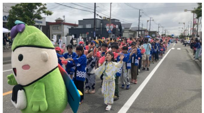
飛び込み参加も含め、総勢100人ほどでパレードに参加