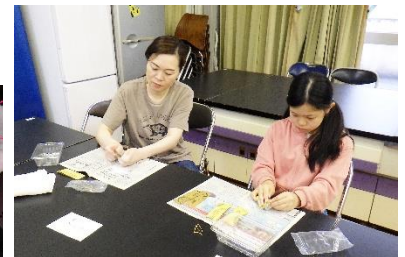
↑まが玉づくりの様子