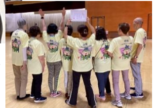
(右)大会には、今年作製したあつまるくんがデザインされたユニフォームで参加