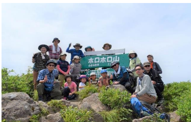
ホロホロ山（1,322.4m）山頂で

登山は、雄大な自然に触れながらの体力づくりには絶好の機会です。来年も予定していますので、初めての方もぜひ参加してみてくださいはいかがでしょうか。乗り越えた喜びと達成感を胸に、味わう絶景は格別です！