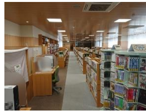
入口から奥まで見える天板のない書架が並ぶ