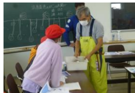
漁協での体験指導