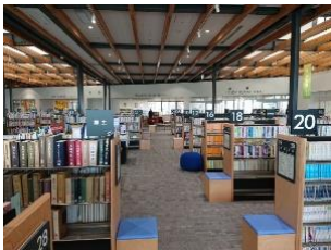
書架が低く、開放的な空間になっている図書コーナー

中富良野町の図書館は教育委員会や福祉施設が入った建物の2階にあります。写真で見た時から気になっていた台形の展示書架は、本の大きさに合わせて高さを変えられる優れもので、様々な展示に重宝しそうですね。他にも、回転式文庫書架や、日光の影響を受けないよう配慮された郷土資料コーナーなど、配架に工夫があり本が探しやすい図書館でした。