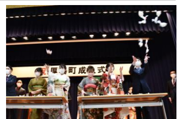
昨年の様子（餅まき企画）

内容 ※4回程度実施予定 地域や保護者の方々への感謝の気持ちを伝えるための演出検討や記念品の選定等 【申込】 社会教育グループ ☎0145-27-2495