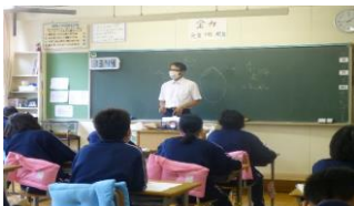
米の流通についての学習支援