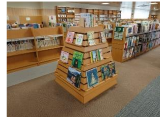
工夫が楽しそうな展示用書架 図書館のシンボル

東川町は町が掲げる「東川町はこういう町」というコンセプトを体現した建物で、図書コーナーもそのコンセプトを担う一部として大切に扱われていると感じました。中富良野町図書館は、だれが利用するのか、だれのための図書館なのかきちんと考えられている図書館だと思いました。「厚真町にこんな図書館ができればいいな」というご意見がございましたら、ぜひ図書室司書までお話を聞かせください。