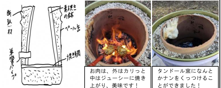
お肉は、外はカリッと中はジューシーに焼き上がり、美味です！ タンドール窯に何とかナンをくっつけることができました！

また、今後の活動として、世界の料理作成と紹介も行っています。まず初めにタンドール窯作りをしました。タンドール窯はナンを焼く際に使うつぼ型オープンです。その作ったタンドール窯を使ってインド料理のナンとタンドリーチキンを焼いてみました。タンドール窯を使ってみたい、または詳しい作り方を知りたい方がいましたら、右記のアドレスまでご連絡ください。