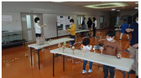
けん玉積み木やドミノで楽しむ参加者

5月29日（日）には第2回（ペタンク体験）を予定していますので、皆さん、ぜひご参加ください。