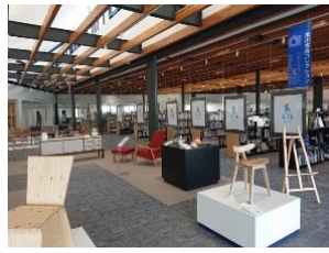
東川名物椅子コレクション