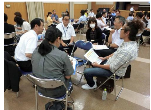
↑ ワークショップで厚真の子どもたちについて語る参加者

※高1クライシス…高校進学後、学習や生活面での大きな環境変化に対応できず、生徒が不登校に陥ったり退学したりする現象。