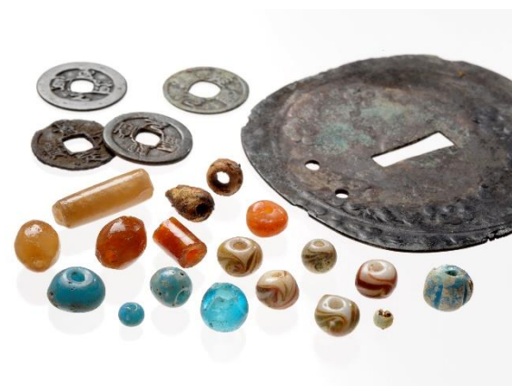
オニキシベ2遺跡 1号墓副葬品 (アイヌ)