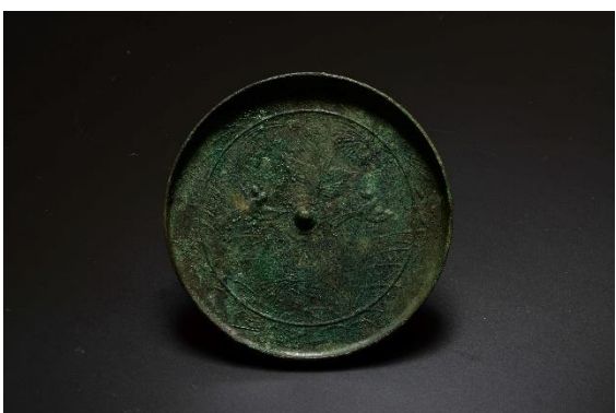
上幌内2遺跡 5号墓副葬品 (アイヌ)