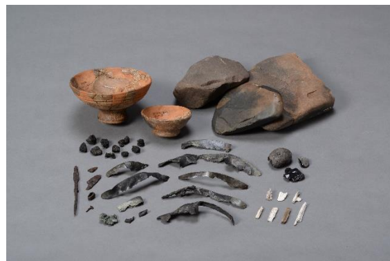
上幌内モイ遺跡 集中区2 (擦文)