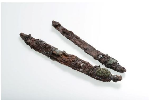
上幌内2遺跡 4号墓副葬品 (アイヌ)