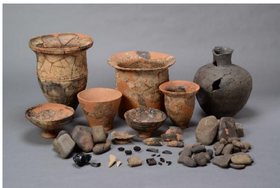
上幌内モイ遺跡 集中区1 (擦文)