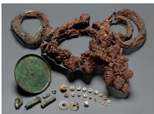
上幌内2遺跡 5号墓副葬品 (アイヌ)