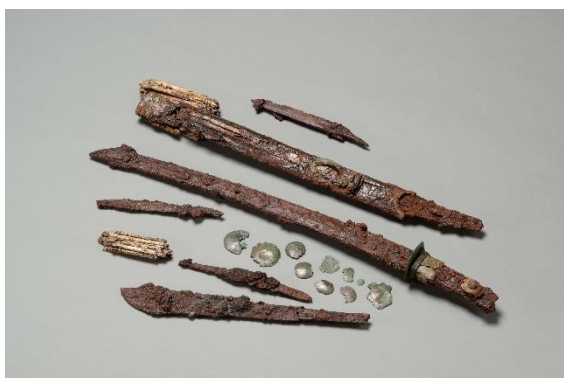
上幌内2遺跡 2号墓副葬品 (アイヌ)