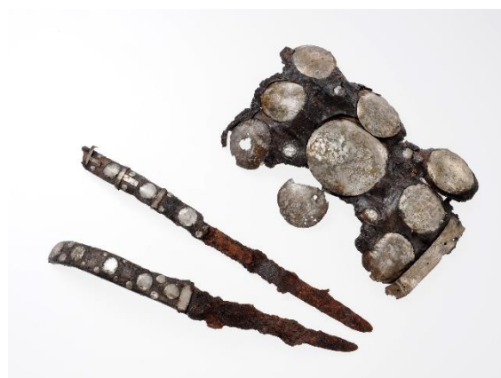
オニキシベ2遺跡 3号墓副葬品 (アイヌ)