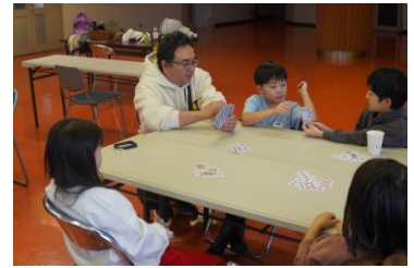
景品をかけたババ抜き大会の予選

教室の最後にはババ抜き大会を行いました。勝ち抜いた人には厚真町の特産品を景品とし、最後まで盛り上がりました。子どもから大人まで一緒になって、お互いにルールを教え合いながら遊び、楽しい時間を過ごすことができました。