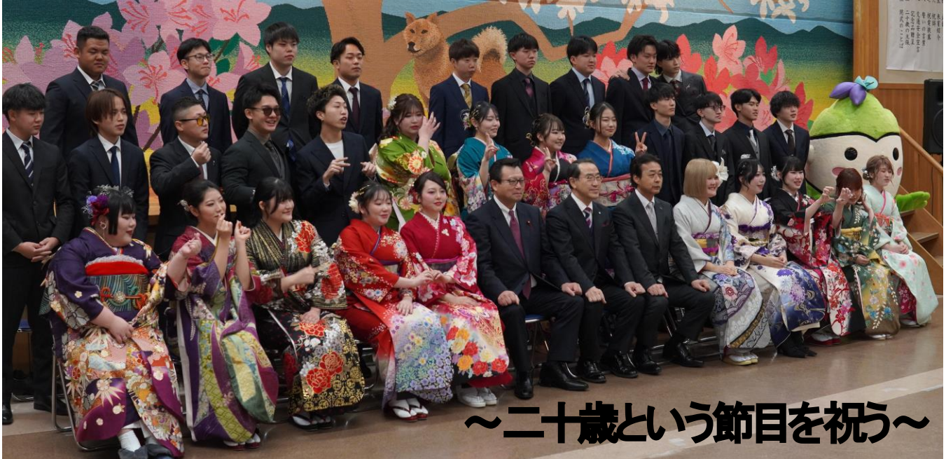
～二十歳という節目を祝う～

1月11日(日)、総合福祉センターを会場に第4回厚真町二十歳のつどいを開催しました。平成17年4月2日から平成18年4月1日までに生まれた46人が対象で、当日は、男性18人、女性15人の合計33人(1人はフランス留学中のためオンラインで参加)が華やかな振袖や真新しいスーツに身を包み、20歳という人生の大きな節目を共に祝いました。