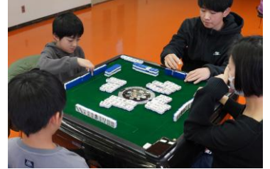
オーラスにドラ10で和了、大逆転