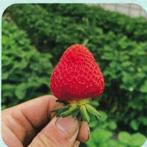
こばやしいちご農園