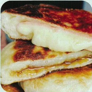
ホットク専門店 シロシカ