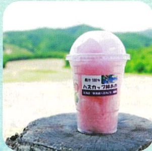
ハスカップシュガー